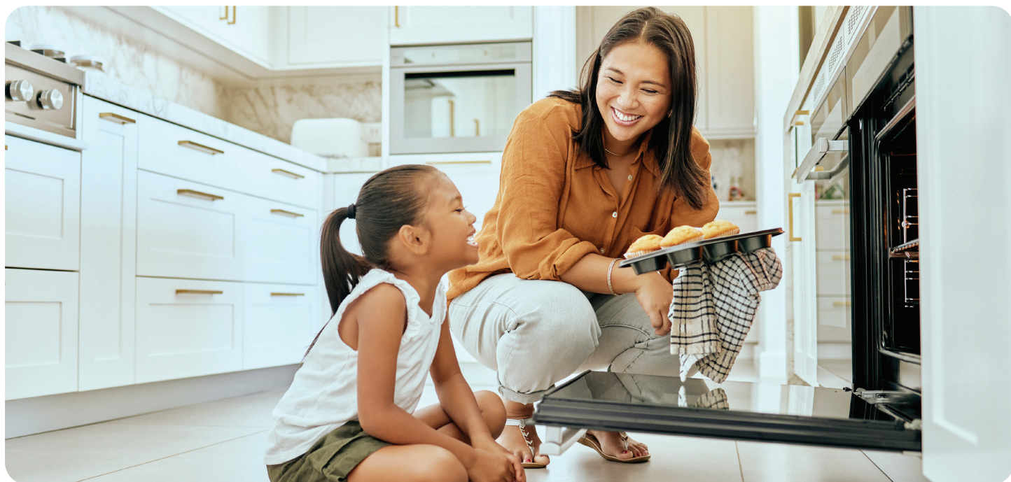
We're making improvements to our system, so you can power through your day – especially when it comes to baking your favorite muffins or cookies.